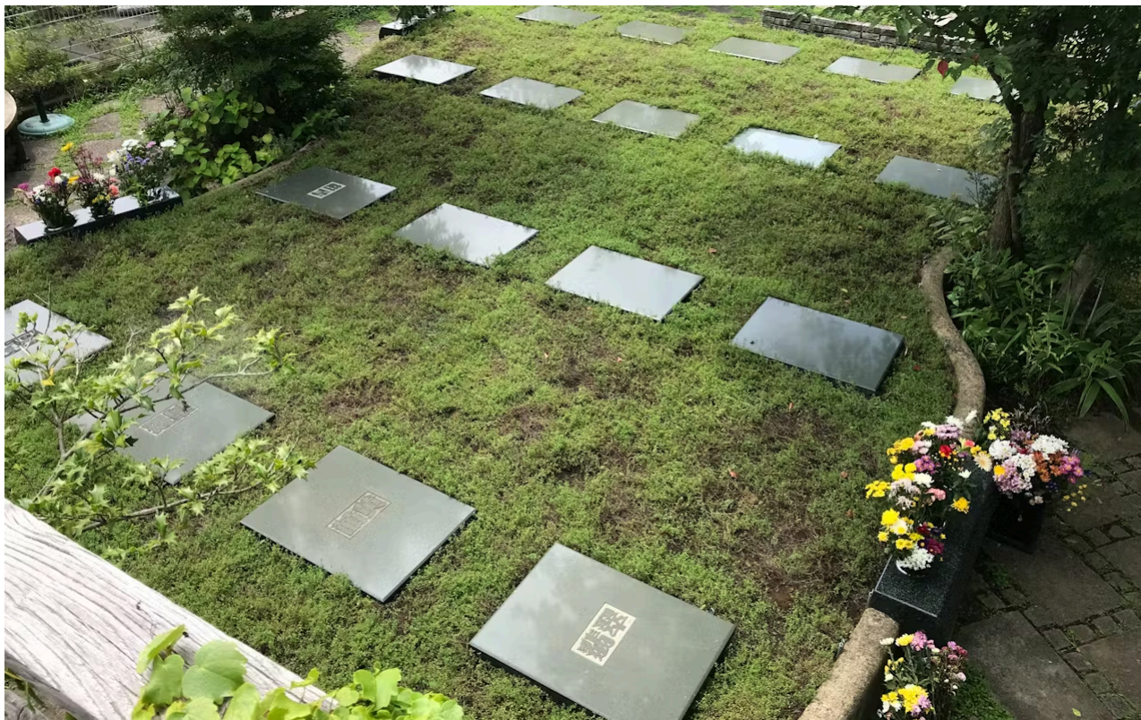
墓石の代わりに木や草花を植えた墓地に埋葬する樹木葬を利用する人は広がっている

今や年間160万人近くの方が亡くなる多死社会。亡くなる人が増えれば、家族の死に直面する人も増える。万一のときに備え、親も子も死後にかかるお金の相場を知っておきたい。現在は墓の購入、葬儀、遺品整理の合計で平均230万円以上かかる。